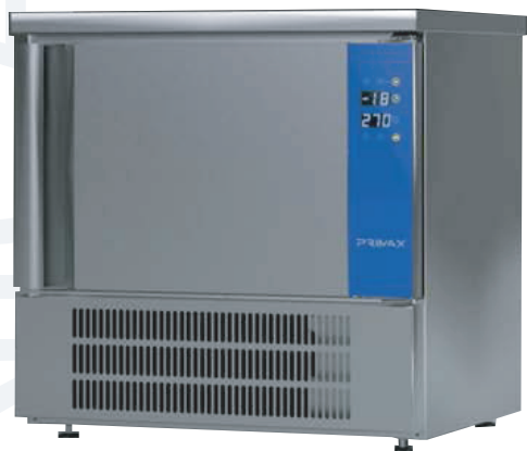
* Fotografía de referencia.